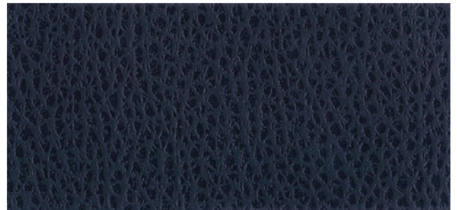
K150 BLAUW - BLEU - BLAU - BLUE